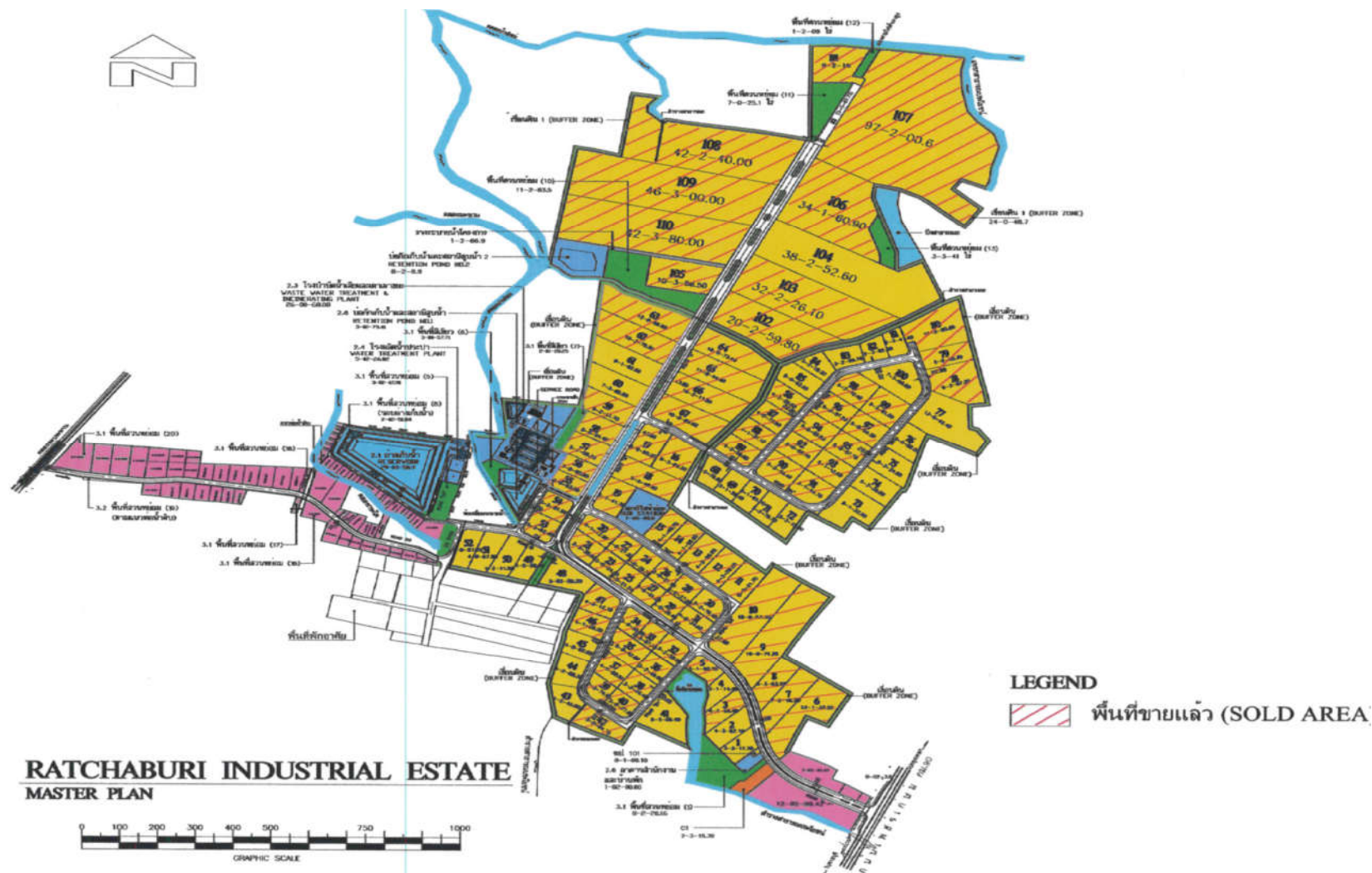
รูปที่ 1.2-2 ผังแสดงขอบเขตพื้นที่นิคมอุตสาหกรรมราชบุรี และรายละเอียดการจัดแบ่งพื้นที่ใช้สอย